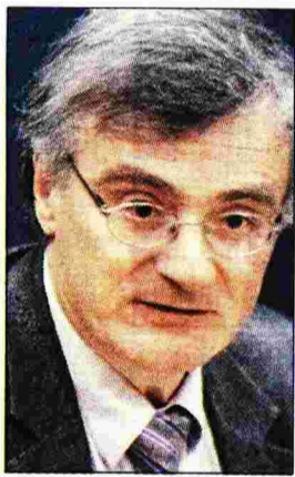
Ο Σπύρης Τσιόδρας

Από τους 101 νεκρούς που είχαν μέση ηλικία τα 73 χρόνια, οι 27 ήταν γυναίκες και το 89% είχε υποκείμενο νόσημα ή ήταν ηλικίας άνω των 70 ετών. Στις Μονάδες Εντατικής Θεραπείας νοσηλεύονται 76 άτομα με μέση ηλικία τα 68 έτη, 17 εκ των οποίων είναι γυναίκες και το 80% εξ αυτών έχει υποκείμενο νόσημα ή ηλικία άνω των 70. Από τους 2.170 ασθενείς οι 555 σχετίζονται με ταξίδια στο εξωτερικό, ενώ 869 με ήδη γνωστό κρούσμα.