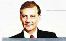
ΤΟΥ ΘΑΝΟΥ ΔΗΜΟΠΟΥΛΟΥ