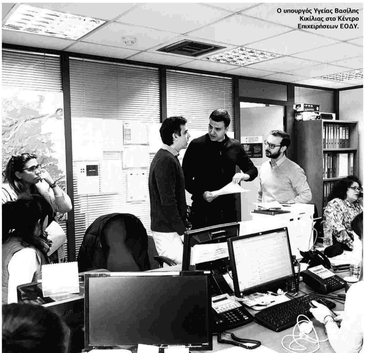
Ο υπουργός Υγείας Βασίλης Κικίλιας στο Κέντρο Επιχειρήσεων ΕΟΔΥ.

Περισσότερα από 504 δείγματα έχουν ελεγχθεί για κορονοϊό και αποδείχθηκαν αρνητικά, τη στιγμή που τα τηλέφωνα έχουν «σπάσει» τις τελευταίες ημέρες, με το τηλεφωνικό κέντρο του ΕΟΔΥ (Εθνικός Οργανισμός Δημόσιας Υγείας) να έχει δεχθεί πάνω από... 40.000 κλήσεις από πολίτες που αναφέρουν στενή επαφή με νοσοκοντα ή ιστορικό ταξιδιού στην Ιταλία και επιθυμούν να μάθουν