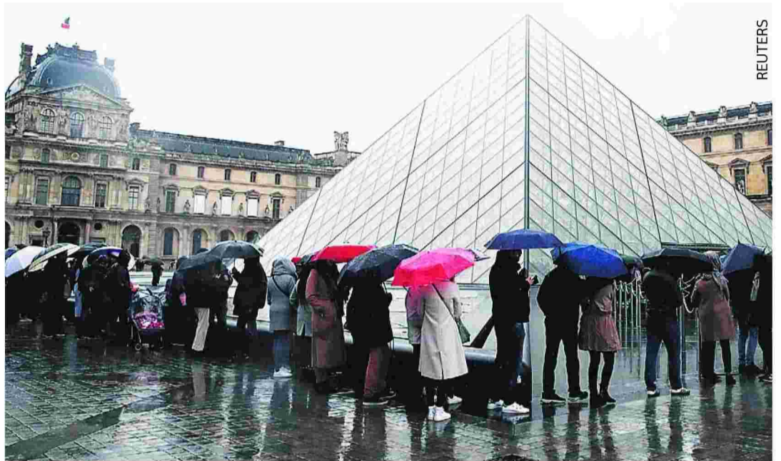
Πάνω: Απογοητευμένοι οι επισκέπτες από το «λουκέτο» στο Μουσείο του Λούβρου. Κάτω: Αυξάνονται συνεχώς τα κρούσματα στις ΗΠΑ. Ο δεύτερος θάνατος ασθενή καταγράφηκε στην Ουάσιγκτον.

ναδέι παθογόνο ιό να μεταδίδεται τόσο εύκολα. Ο περιορισμός της COVID-19 θα πρέπει να αποτελεί την απόλυτη προτεραιότητα για όλες τις χώρες», δήλωσε. Παράλληλα, ο ΠΟΥ κάλεσε την Κυριακή όλες τις χώρες του κόσμου να προμηθευτούν συσκευές αναπνευστικής υποστήριξης προκειμένου να αντιμετωπίσουν την επιδημία του νέου κορονοϊού. ■