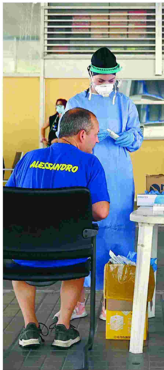
Ελεγχος για κορωνοϊό από κλιμάκιο του ΕΟΔΥ στον Προμαχώνα. Από τα 36 εισαγόμενα κρούσματα COVID-19 που εντοπίστηκαν χθες, τα 20 αφορούν ταξιδιώτες από τη Σερβία.

Ο καθηγητής Μικροβιολογίας στο Πανεπιστήμιο Δυτικής Αττικής, Αλκιβιάδης Βατόπουλος, εξέφρασε χθες (ΣΚΑΪ) την ανησυχία του για τις εικόνες συνωστισμού, σημειώνοντας μάλιστα ότι ίσως θα πρέπει να εξετασθεί ακόμα και το ενδεχόμενο απαγόρευσης αυτών των εκδηλώσεων. Όπως είπε, έστω αν υπάρχει ένα άτομο που έχει μολυνθεί από τον ιό μπορεί να δημιουργήσει εκατοντάδες κρούσματα. «Τα έχουμε ξαναπεί. Ο κόσμος θέλει να διασκεδάσει αλλά ο ιός δεν ξέρει από αυτά».