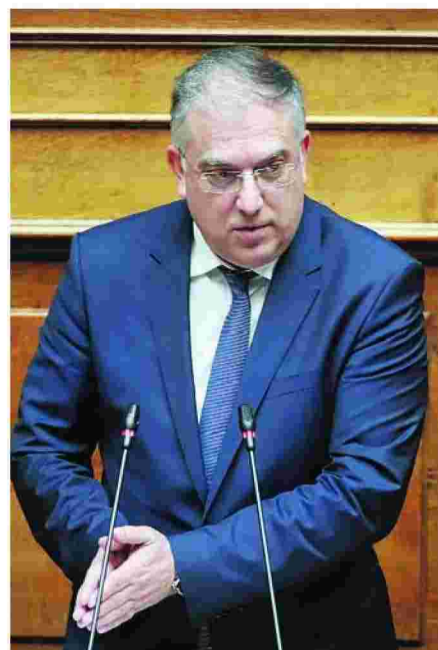
Οι υπουργοί Εσωτερικών Τάκης Θεοδωρικάκος και Παιδείας Νίκη Κεραμέως σε συνεργασία με τους ειδικούς λοιμωξιολόγους προετοιμάζουν το έδαφος για το ασφαλές άνοιγμα των σχολείων στις 7 Σεπτέμβρη.