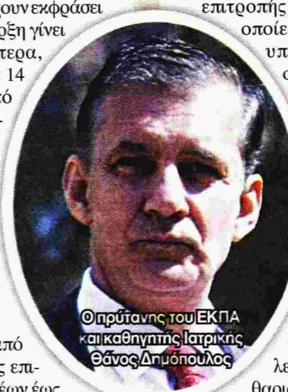
Ο πρόεδρος του ΕΚΠΑ και καθηγητής Ιατρικής Θάνος Δημόπουλος

Σύμφωνα με τις εισηγήσεις της επιτροπής λοιμωξιολόγων, τις οποίες έχει αποδεχτεί το υπουργείο Παιδείας, οι μαθητές όλων των βαθμίδων και οι εκπαιδευτικοί θα πρέπει υποχρεωτικά να φορούν μάσκα στους εσωτερικούς χώρους του σχολείου. Σύμφωνα με όσα έχουν γίνει γνωστά, χωρίς να έχουν ανακοινωθεί επίσημα, θα γίνονται διαφορετικά διαλείμματα ανά τάξη, καθαρισμός των σχολείων κατά τη λειτουργία τους και μετά το πέρας των μαθημάτων και σε όλα τα σχολεία θα υπάρχουν αντισηπτικά, με ευθύνη των δήμων.