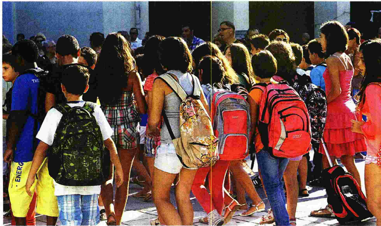
Με αγωνία μαθητές, γονείς και εκπαιδευτικοί περιμένουν την αυριανή αυλαία στα σχολεία της χώρας