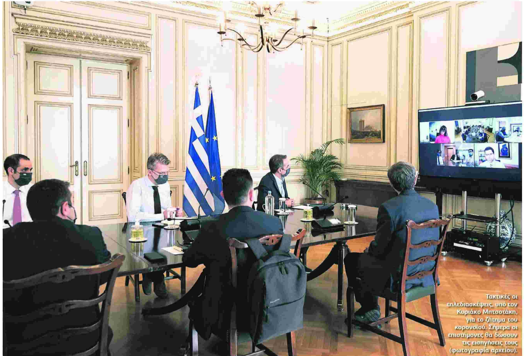
Τακτικές οι τηλεδιασκέψεις, υπό τον Κυριάκο Μητσοτάκη, για το ζήτημα του κορονοϊού. Σήμερα οι επιστήμονες θα δώσουν τις εισηγήσεις τους (φωτογραφία αρχείου).

LOCKDOWN: ΠΑΡΑΤΑΣΗ ΜΕΧΡΙ 14 ΔΕΚΕΜΒΡΙΟΥ, ΜΗΝΥΜΑ ΜΗΤΣΟΤΑΚΗ ΤΗΝ ΠΑΡΑΣΚΕΥΗ, ΣΗΜΕΡΑ ΟΙ ΑΠΟΦΑΣΕΙΣ