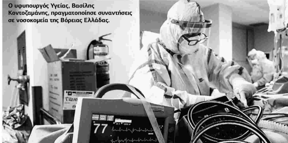
Ο υφυπουργός Υγείας, Βασίλης Κοντοζαμάνης, πραγματοποίησε συναντήσεις σε νοσοκομεία της Βόρειας Ελλάδας.

Ο αριθμός των διασωληνωμένων ανήλθε χθες σε 596. Το ισοζύγιο νέων εισαγωγών στα νοσοκομεία και εξιτηρίων είναι ένας τους παράγοντες που θα λάβουν υπόψη τους οι ειδικοί προκειμένου να εισηγηθούν αποκλιμάκωση των μέτρων. Μικρή αποσυμφόρηση στο σύστημα υγείας έχει αρχίσει να γίνεται αισθητή, τουλάχιστον όσον αφορά στις νέες εισαγωγές. Σύμφωνα με πληροφορίες, οι νέες εισαγωγές έπεσαν κάτω από τις 400 μετά από πολλές ημέρες. Άλλες παράμετροι είναι ο αριθμός των ημερήσιων κρουσμάτων, ο αριθμός νοσηλευόμενων και διασωληνωμένων, τα ποσοστά ενεργών κρουσμάτων ανά περιοχή, το ποσοστό θετικότητας και ο δείκτης μεταδοτικότητας Rt. ■