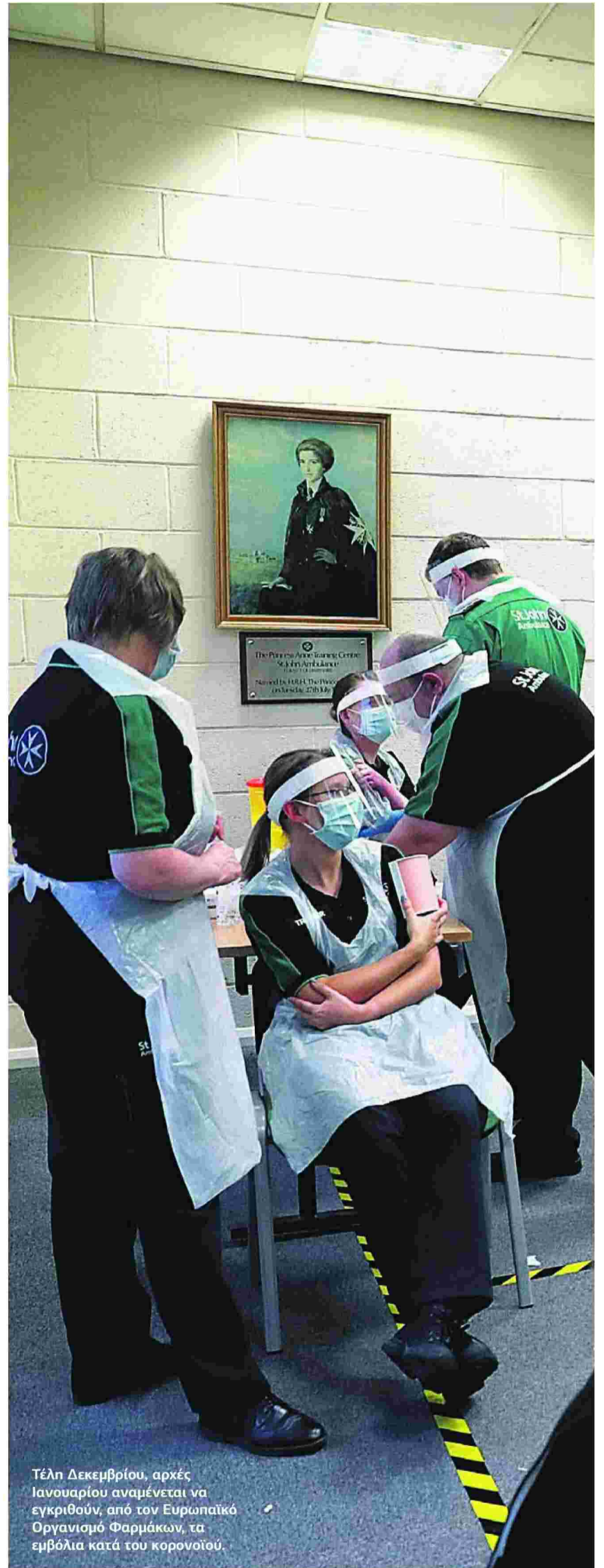
Τέλη Δεκεμβρίου, αρχές Ιανουαρίου αναμένεται να εγκριθούν, από τον Ευρωπαϊκό Οργανισμό Φαρμάκων, τα εμβόλια κατά του κορονοϊού.

Στη χώρα μας, σύμφωνα με τον υφυπουργό Υγείας, Βασίλη Κοντοζαμάνη, ο συνολικός αριθμός των ψυγείων με ειδικές συνθήκες, πολύ χαμηλές συνθήκες θερμοκρασίας που απαιτούνται προκειμένου να αποθηκευτούν τα εμβόλια που θα έρθουν στη χώρα, είναι 14. Τα επτά έχουν ήδη φτάσει στην Ελλάδα και τα υπόλοιπα επτά έρχονται αυτή την εβδομάδα. Ο σχεδιασμός για τη διανομή των εμβολίων στη χώρα μας περιλαμβάνει την αποθήκευση των εμβολίων σε κεντρικές αποθήκες και από εκεί θα μεταφέρονται στα εμβολιαστικά κέντρα, όπου και θα μπορούν να διατηρούνται έως πέντε ημέρες σε κανονικό ψυγείο. ■