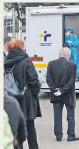
Ο ΕΟΔΥ χθες ανακοίνωσε 597 κρούσματα, αριθμό μικρότερο σε σχέση με τις προηγούμενες ημέρες, ενώ ο αριθμός των τεστ, μάλιστα, ήταν υψηλός.

ΣΕ ΤΕΝΤΩΜΕΝΟ σκηνί εξακολουθεί να ισορροπεί η επιδημία στη χώρα μας, με τον αριθμό των διασωληνωμένων να διατηρείται σε υψηλό επίπεδο και δεκάδες ασθενείς να κάνουν καθημερινά τη μάχη για τη ζωή τους.