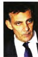
Θάνος Δημόπουλος Πρύτανης ΕΚΠΑ, καθηγητής Αιματολογίας- Ογκολογίας, δ/ντης Θεραπευτικής Κλινικής Ιατρικής Σχολής ΕΚΠΑ

ΣΥΜΠΕΡΑΣΜΑΤΙΚΑ , μπορούμε να ατενίζουμε με αισιοδοξία την έλευση του 2021, ώστε με προσεκτικά βήματα να επανέλθουμε στην καθημερινότητα, αποφεύγοντας νέα κύματα της πανδημίας και έχοντας πολύτιμες γνώσεις και εμπειρίες για την πρόληψη εξάπλωσης και την ταχεία ανταπόκριση σε μελλοντικές επιδημίες. ■