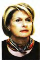
Μίνα Γκάγκα Πρόεδρος του Κεντρικού Συμβουλίου Υγείας (ΚΕΣΥ), διευθύντρια της 7ης Πνευμονολογικής Κλινικής του νοσοκομείου «Σωτηρία»

Τ ο πρώτο κύμα της πανδημίας στην Ελλάδα πήγε πολύ καλά και γιατί λήφθηκαν μέτρα νωρίς και γιατί ανταποκρίθηκαν πολύ καλά το ιατρονοσηλευτικό προσωπικό και γενικά οι επαγγελματίες Υγείας, παρά τα 10 χρόνια κρίσης που άφησαν φτωχότερο το ΕΣΥ.