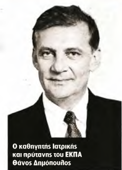
Ο καθηγητής Ιατρικής και πρύτανης του ΕΚΠΑ Θάνος Δημόπουλος

Τα σκευάσματα κατά της πανδημίας βρίσκονται στο στάδιο των κλινικών ερευνών και θα είναι διαθέσιμα τους επόμενους μήνες σε νοσοκομεία και φαρμακεία