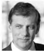
ΤΟΥ ΘΑΝΟΥ ΔΗΜΟΠΟΥΛΟΥ, πρύτανη του ΕΚΠΑ

Ο βαθμός στον οποίο η προηγούμενη μόλυνση με τον ιό SARS-CoV-2 παρέχει προστασία σε επακόλουθη επαναμόλυνση δεν έχει εκτιμηθεί πλήρως. Ερευνητές από τη Δανία δημοσίευσαν στο περιοδικό Lancet τα αποτελέσματα μιας μεγάλης μελέτης που βασίστηκε στην καταγραφή όλων των μοριακών τεστ που έγιναν το 2020 στη χώρα. Οι καθηγητές της Θεραπευτικής Κλινικής της Ιατρικής Σχολής του Εθνικού και Καποδιστριακού Πανεπιστημίου Αθηνών Ευστάθιος Καστρίτης και Θάνος Δημόπουλος (πρύτανης ΕΚΠΑ) ( https://mdimor.gr/covid19/ ) συνοψίζουν τα κύρια ευρήματα της μελέτης. Στη Δανία, μέσα στο 2020, περίπου 4 εκατομμύρια άτομα (69% του πληθυσμού) υποβλήθηκαν σε 10,6 εκατομμύρια μοριακά τεστ, στο πλαίσιο μιας στρατηγικής εκτεταμένων, δωρεάν, μοριακών τεστ. Χρησιμοποιώντας λοιπόν αυτά τα εθνικά δεδομένα από τα μοριακά τεστ που έγιναν μέσα στο 2020, οι ερευνητές προσπάθησαν να εκτιμήσουν τον βαθμό προστασίας έναντι επαναλοίμωξης από τον ιό SARS-CoV-2. Κατά τη διάρκεια του πρώτου επιδημικού κύματος (δηλ., πριν από τον Ιούνιο, 2020), περίπου μισό εκατομμύριο άτομα υποβλήθηκαν σε μοριακό τεστ, εκ των οποίων 2,2% ήταν θετικοί. Μεταξύ των θετικών ατόμων από το πρώτο κύμα της πανδημίας, 72 (δηλαδή 0,65%) βρέθηκαν ξανά θετικά σε μοριακό τεστ κατά τη διάρκεια του δεύτερου κύματος, σε σύ-