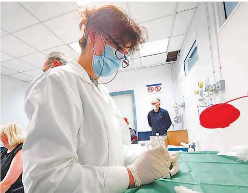
Νέα στοιχεία σχετικά με την ασθένεια μιας σειράς ερευνητών στο Ινστιτούτο Ιολογίας της Γουάσινγκτον, της πόλης απ' όπου θεωρείται ότι ξεκίνησε ο νέος κορωνοϊός, που έμελλε να μετεξελιχτεί σε πανδημία, φέρνει στο φως έκθεση των υπηρεσιών πληροφοριών των ΗΠΑ.

Η έκθεση, που είχε δημοσιοποιηθεί στη διοίκηση Τραμπ τον Ιανουάριο, ανέφερε μεν ότι οι ερευνητές είχαν ασθενήσει το φθινόπωρο του 2019, αλλά δεν ήταν γνωστό ότι είχε χρειαστεί να εισαχθούν σε νοσοκομεία. Υπενθυμίζεται ότι η Κίνα γνωστοποίησε στον Παγκόσμιο Οργανισμό Υγείας ότι ο πρώτος ασθενής με συμπτώματα κορωνοϊού καταγράφηκε στη Γουάσινγκτον στις 8 Δεκεμβρίου 2019. Παρά τη σοβαρότητα των συμπτωμάτων, οι συντάκτες της έκθεσης δεν μπορούσαν να πουν με βεβαιότητα ότι πρόκειται για κορωνοϊό, παρά το γεγονός ότι μιλάμε για ασθένεια σε κεντρικό έδαφος. Η επικεφαλής των Υπηρεσιών Πληροφοριών Αββίλ Χέινς είπε τον περασμένο μήνα ότι «ο μυστικός υπηρεσίας δε γνωρίζουν πού, πότε ή πώς μεταδόθηκε αρχικά ο COVID-19», και η εκτίμηση αυτή δεν έχει αλλάξει, όπως αναφέρουν οι πηγές της Wall Street Journal που μίλησαν για την έκθεση. Τα νέα στοιχεία, πάντως, ενισχύουν την πεποίθηση ότι ο ιός προήλθε από φυσικό αίτιο, μέσω της επαφής ζώου-ανθρώπου, χωρίς να αποκλείεται η πιθανότητα ο ιός να ήταν αποτέλεσμα κάποιας συσκευασίας διαρροής από το Ινστιτούτο της Γουάσινγκτον, όπου οι ερευνητές εξέταζαν νικετιδίες.