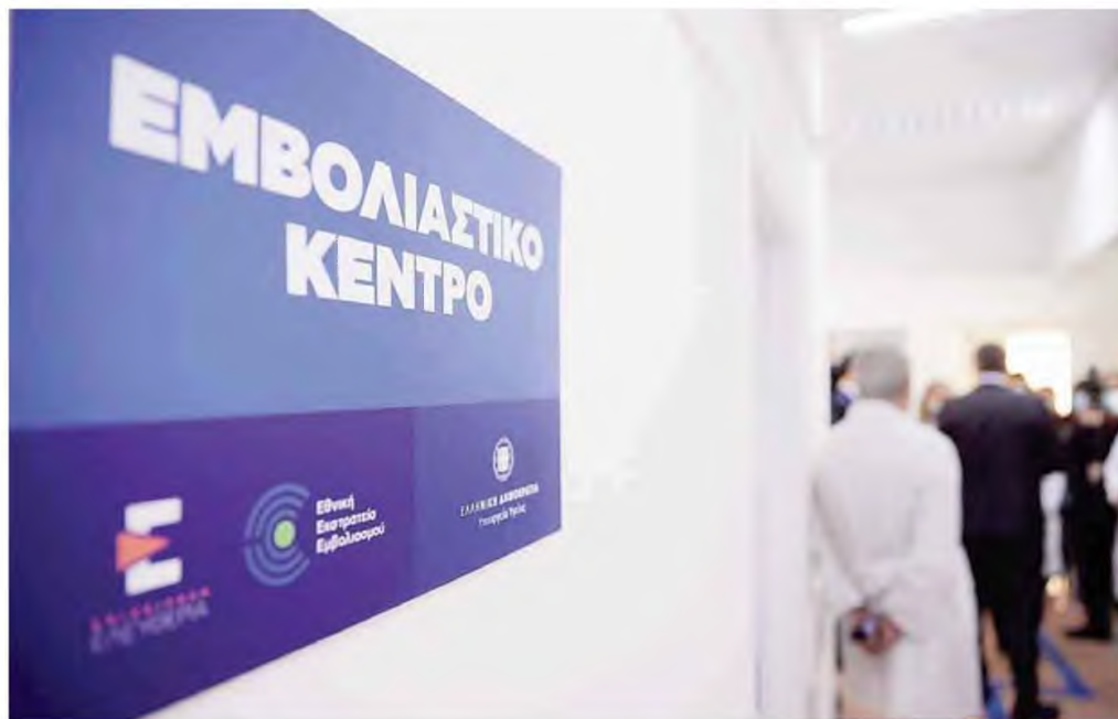
Με μία δόση έχουν εμβολιαστεί 3.250.000 πολίτες, ποσοστό που αντιστοιχεί στο 31%, και 1.800.000 πολίτες έχουν ολοκληρώσει τον εμβολιασμό τους, ποσοστό που αντιστοιχεί στο 17,2%.

■ Από αύριο, με όλο το πλέγμα των σκευασμάτων (Pfizer, Moderna, AstraZeneca και Johnson & Johnson) - 1.45.000 Έλληνες 40-44 ετών έχουν ήδη κλείσει ραντεβού