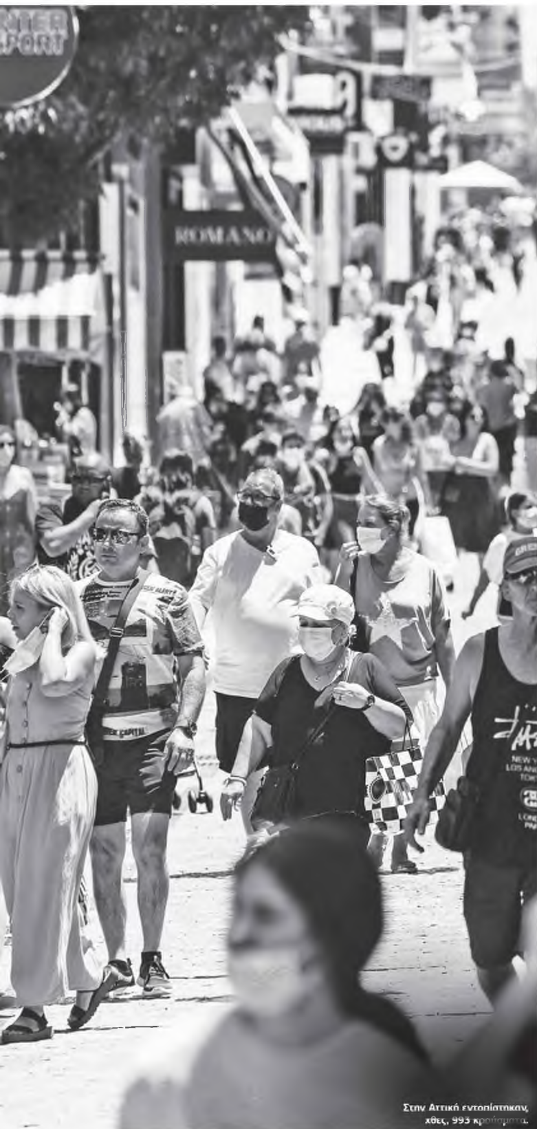
Στην Αττική εντοπίστηκαν, χθες, 993 κρούσματα.